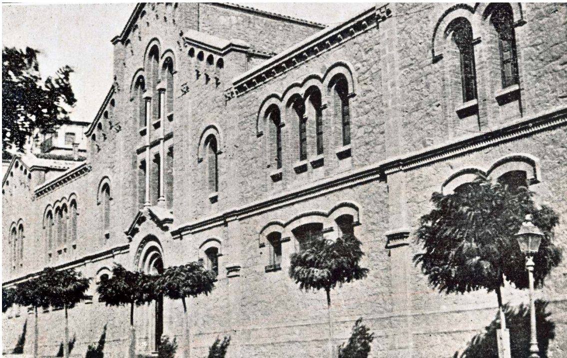
Figura 4.- Edifici de l'Asil d'Infants Orfes situat a la cantonada del carrer dels Infants amb la carretera de Vic acabat de construir l'any 1901 segons projecte de l'arquitecte Ignasi Oms i Ponsa i situada al costat de casa els meus avis. Fotografia editada a l'àlbum titulat "Album de Manresa" editat per en Lluís Roca i Pla aquell mateix any 1901. En aquest col·legi hi vaig romandre aprenent les beceroles des de l'any 1958 fins a 1960. (AJVMP).

número 22, actualment número 18, situada al costat mateix de l'edifici del Col·legi i Asil dels Infants Orfes, construït l'any 1901 segons projecte de l'arquitecte Ignasi Oms i Ponsa, i separats únicament per un petit passatge que dona a un tros de l'interior de l'illa compresa per la mateixa carretera de Vic, carrer Flors de Maig -aleshores anomenat carrer Arcs-, carrer Puigterrà de Dalt, i plaça i carrer dels Infants. Vilaclara l'any 1873 que era l'avi de Baltasar Portabella i Espinalt, el meu avi, i que era pare de Lluís Espinalt i Padró. Aquest veïnatge i el fet que els meus avis eren catòlics practicants i estaven molt lligats a l'església del Carme, per ser la seva parròquia, però sobretot ho estaven a la comunitat religiosa de les monges de Joaquina de Vedruna dels Infants amb qui mantenien una estreta relació de veïnatge i de creences per la qual cosa aquest fet va provocar que anés a aprendre les beceroles al col·legi dels infants (figura 4). La casa dels avis situada a la carretera de Vic número 22, actualment número 18, la va construir en Josep Espinalt i Vilaclara l'any 1873, natural de Santpedor, que era el pare de Lluís Espinalt i Padró l'avi de Baltasar Portabella i Espinalt el meu avi.