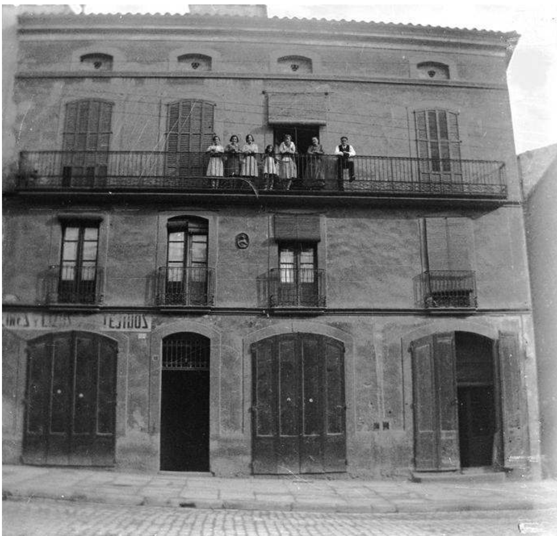
Figura 5.- La casa familiar situada a la carretera de Vic número 22, actualment 18, situada just al costat de l'Asil d'Infants Orfes regentat per les monges vedrunes, amb la família Portabella Oliveras al balcó de la seva vivenda. A sota, en el moment de la fotografia a la dècada de 1920 als locals comercials hi havia a l'esquerra la llauneria de Francesc Señal que també construïa capses de galetes, pintes i llisos per a la indústria tèxtil i filtres d'aigua, i a la dreta el despatx de la fàbrica de la raó social "Morell i Cura" que fabricaven el "Vermouth Marconi" i el popular "Anís del Bages". Més endavant l'any 1947 al local de l'esquerra els meus avis hi van obrir la Merceria i perfumeria "Portabella"..

dia, una al matí i una altra a la tarda. Després també el fèiem dues vegades més a l'inrevés per anar de l'escola fins a casa.