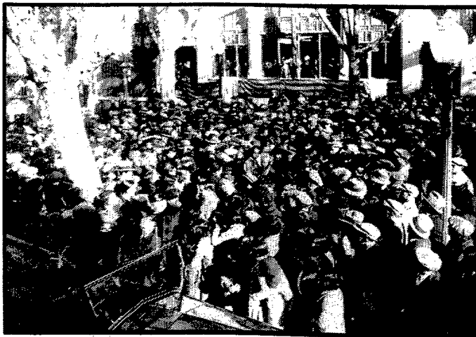
2ª visita de Macià. El President surt de l'estatge de la Unió Catalana Republicana, situat al Passeig.

En sortir Macià a fora, una cobla tocà "Els Segadors", hime que fou rebut amb forts aplaudiments. Macià s'acomiadà de la ciutat i es dirigí a Sant Vicenç de Castellet, última etapa de la seva visita al Bages.