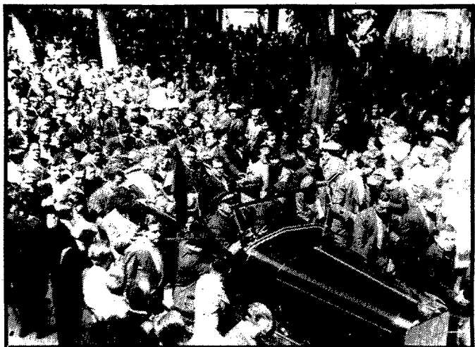
Macià al Passeig.