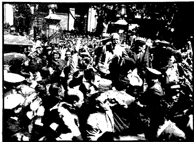
Arribada de Macià al teatre Kursaal. La gent, enfervorida, aclama el President.

Miting nacionalista al teatre Kursaal, en commemoració de les Bases de Manresa. Macià encara no havia arribat.