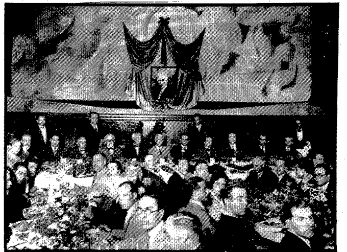
Banquet a l'Hotel Mundial en honor al President Macià.