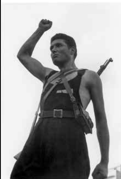
Retrats de combatents. S.D.