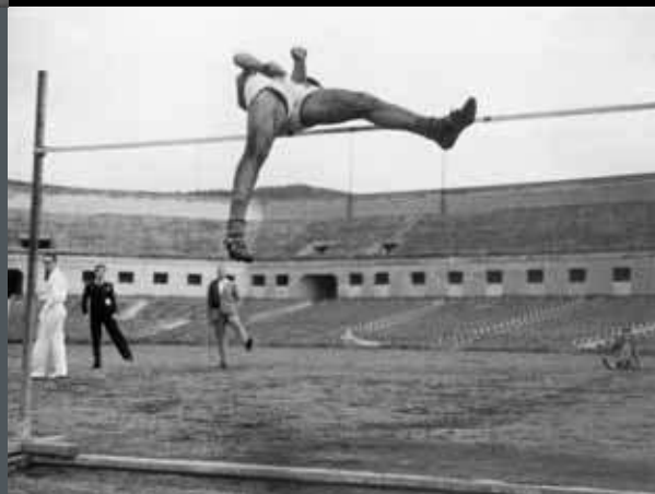
Atletisme. Salt d'alçada. Estadi de Montjuïc. Barcelona.1936.