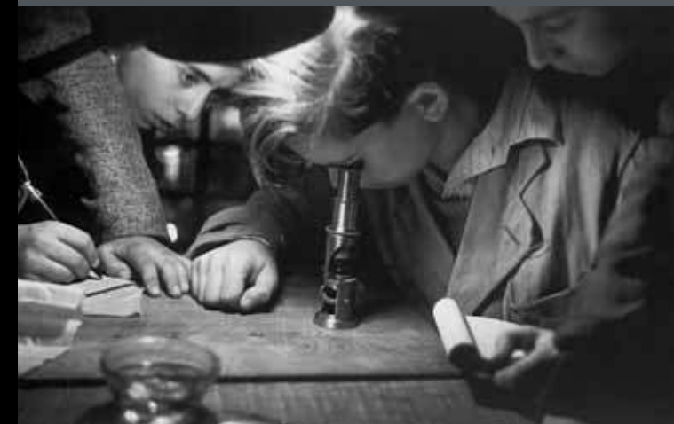
Escola nova unificada. Barcelona. S.D.