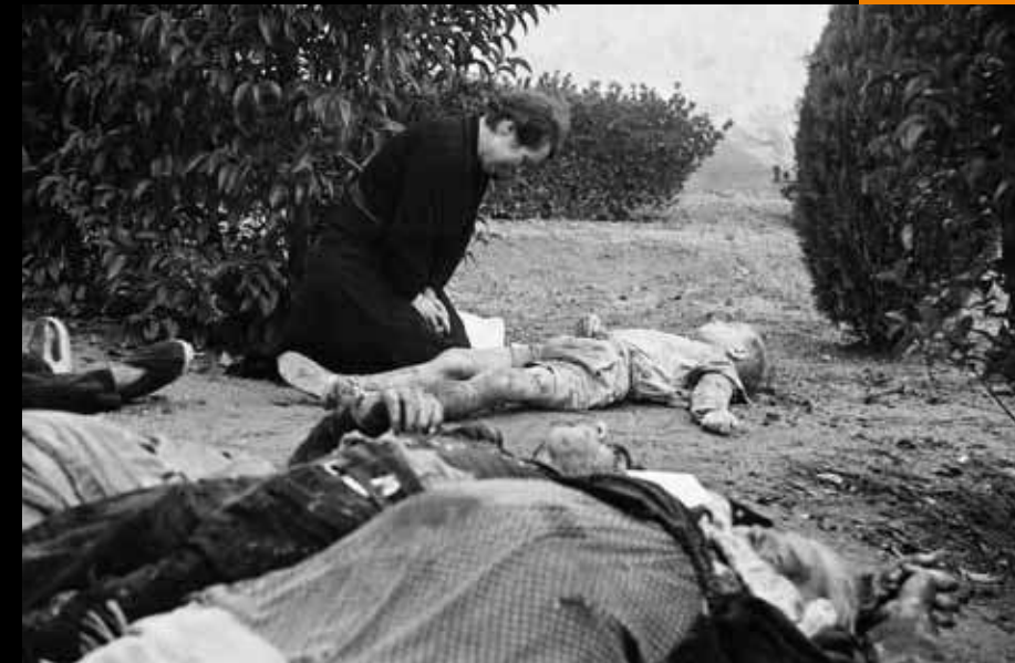
Bombardeig de Lleida. Lleida. 2 de novembre de 1937.