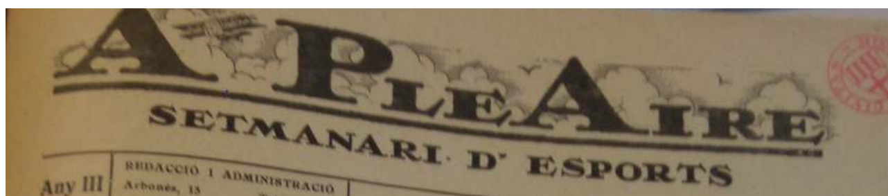
Autor: Aleix Solernou Puig Estudi supervisat per: Josep Maria Figueres