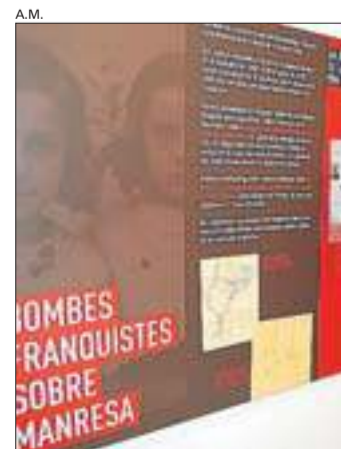
L'exposició del Museu Comarcal