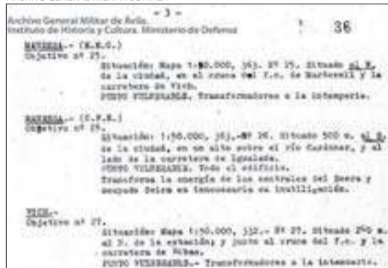
Una part de l'informe dels atacs als transformadors