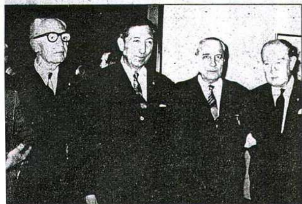
3. D'esquerra a dreta: Ferreras i Duran, President del Parlament de Catalunya; B. ex-diputad, Pte. de l'Orden de Liberación i representant del President de la República Alemán, ex-president de Mèxic; Jimenez de Asúa, President de la República anyola i Manuel Tello, Ministre de Relacions Exteriors de Mèxic.