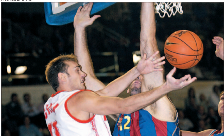
Un moment del partit d'ahir al Palau Blau-grana