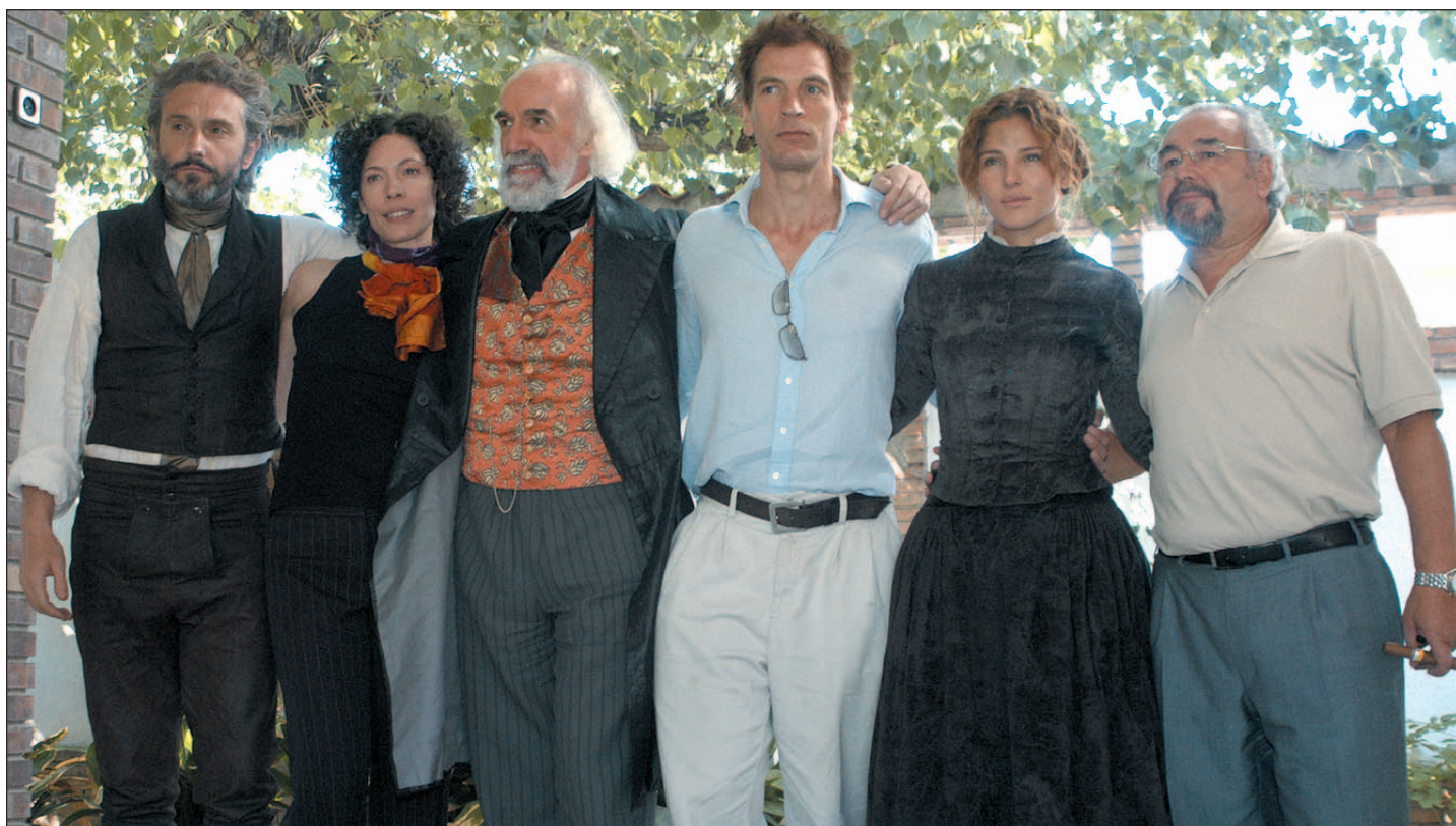
L'EQUIP DE 'ROMASANTA', EL DARRER RODATGE QUE HA ACOLLIT EL MONESTIR DE SANT BENET DE BAGES (SETEMBRE 03)