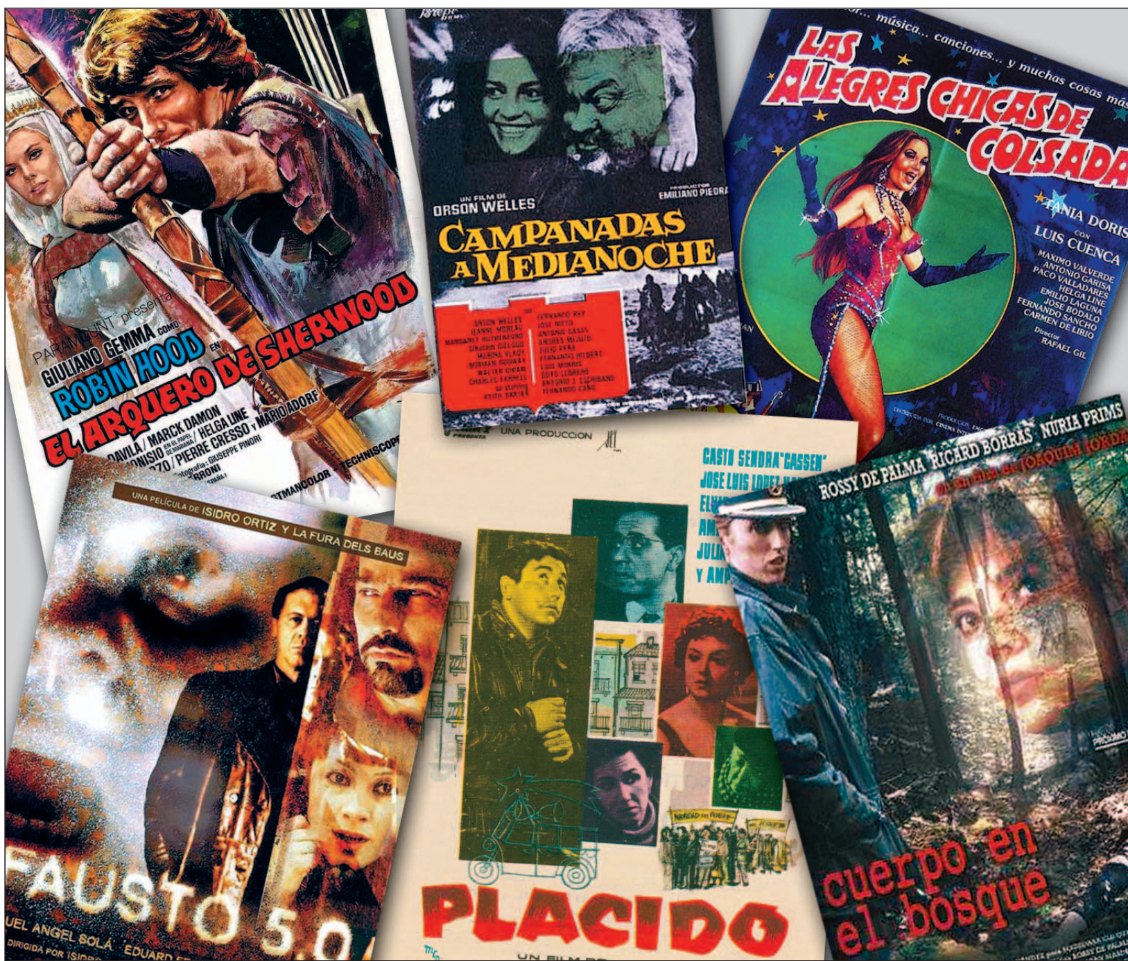
CARTELLS D'ALGUNES DE LES PEL·LÍCULES QUE S'HAN RODAT AL BAGES ENTRE 'PLÁCIDO', EL 1961, I 'ROMASANTA', EL SETEMBRE PASSAT