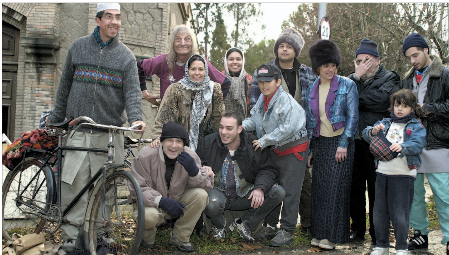
LA FURA DELS BAUS VA AMBIENTAR ALGUNES ESCENES DE 'FAUST 5.0' A LA FÀBRICA NOVA DE MANRESA, EL FEBRER DEL 2001