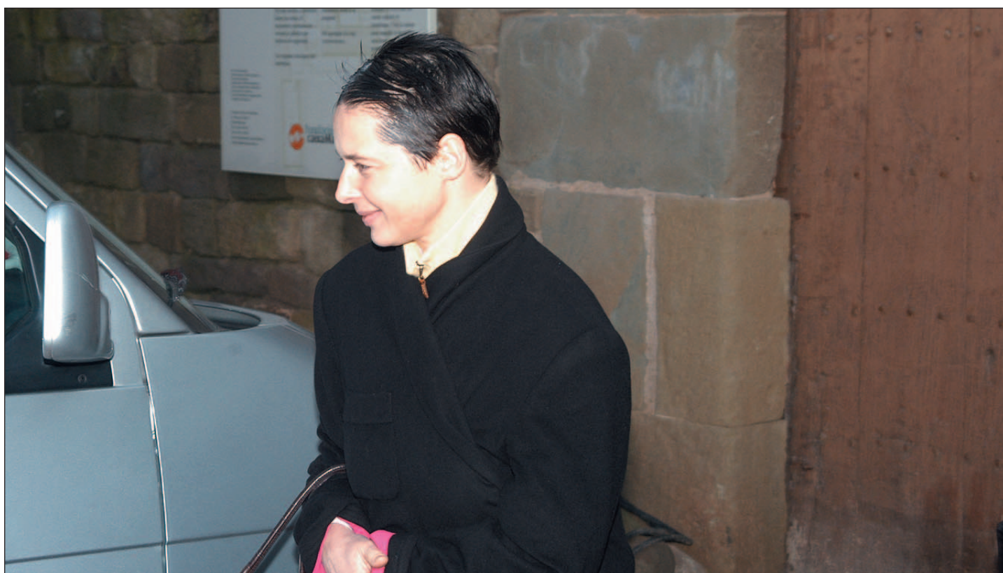
ISABELLA ROSSELLINI SORTINT DE SANT BENET, DESPRÉS DE GRAVAR-HI PER A 'LAS MALETAS DE TULSE LUPER 2' (FEBRER 03)