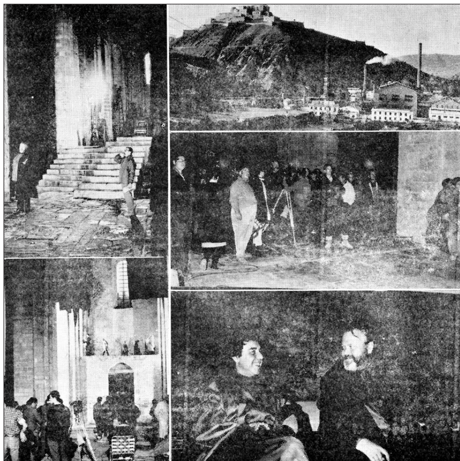
FOTOGRAFIES DEL RODATGE DE 'CAMPANADAS A MEDIANOCHÉ' A CARDONA (1964)