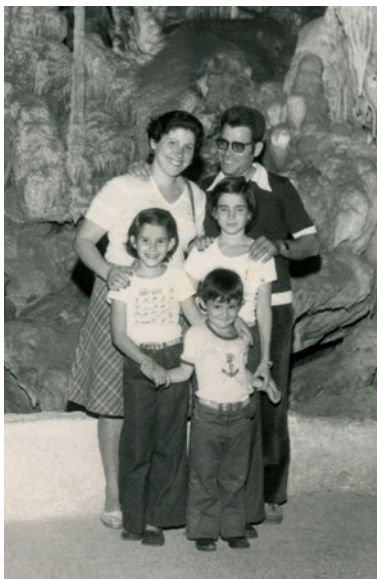
1976. Tota la família vam fer un viatge a Mallorca per celebrar els deu anys de casats amb la Isabel.