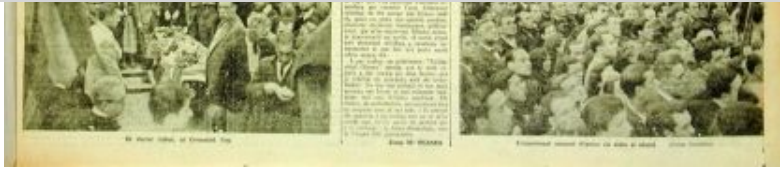
Portada de 'La Publicitat' de l'1 de maig del 1936 en què el titular destacat és l'enterrament dels germans Badia

Arran dels fets d'octubre del 1934, quan el Govern de la Generalitat, amb el president Lluís Companys al capdavant, és empresonat, 'El Be Negre' és clausurat tres setmanes. Amb tot, la suspensió més traumàtica no arribarà fins el setembre del 1935, quan Planes és acusat d'un delictes de desobediència civil en no portar les proves a censura. 'El Be Negre' no tornarà a publicar-se fins a la darrera de gener del 1936 i Planes marxa a París i a Berlín, com a corresponsal de 'La Publicitat'. A la capital alemanya, el periodista català contempla de prop l'apogeu del nazisme: "M'ha calgut anar a Berlín per veure com la gent aplaudia l'activitat eixordadora d'un canó antiaeri, per veure ovacionar un tanc monstruós que agafava tot el llenç i semblava que anava a esclafar el públic, per veure com els picaments de mans ofegaven el petar de les metralladores. [...] Tot plegat tenia l'aire d'una broma sinistra", escriu.