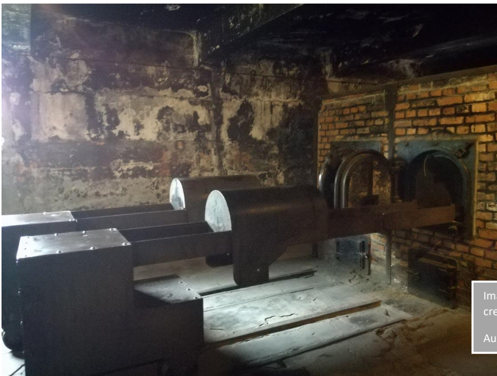
Imatge 15. Forns crematoris.