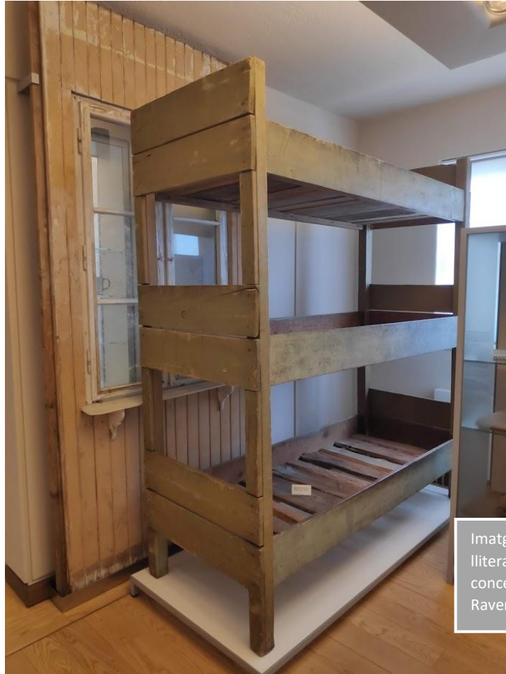
Imatge 3. Reconstrucció de llitera del camp de concentració de Ravensbrück.