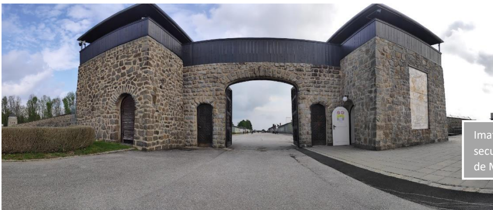
Imatge 8. Entrada secundària del camp de Mauthausen.