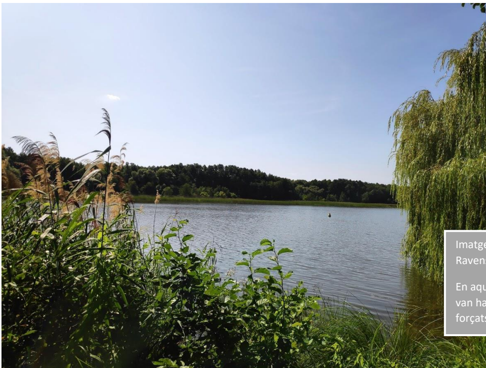
Imatge 2. Llac Schwedt de Ravensbrück.

En aquest llac, les deportades hi van haver de fer molts treballs forçats.