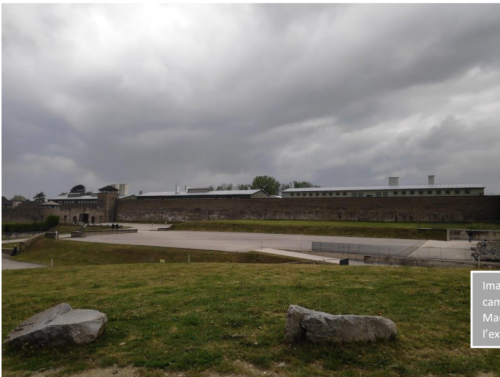
Imatge 6. Vistes del camp de Mauthausen des de l'exterior.