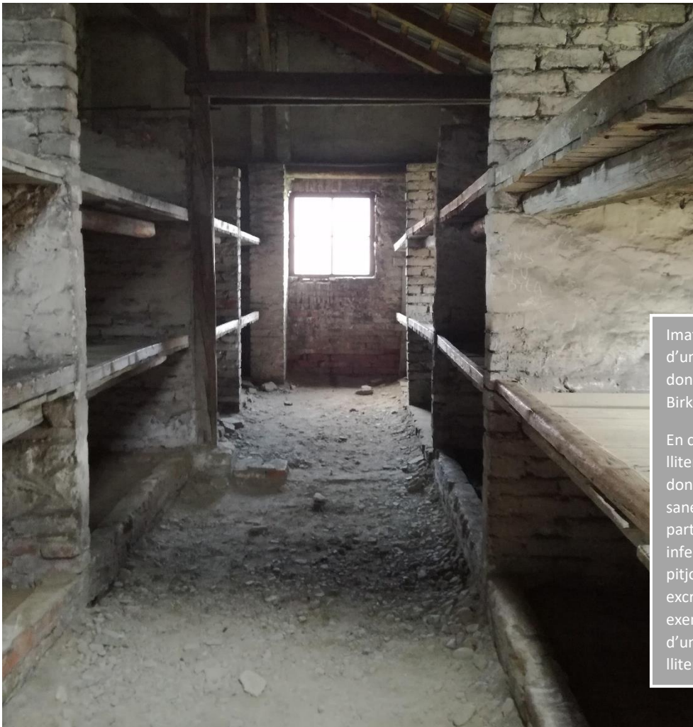
Imatge 18. Exemple d'un dels barracons de dones d'Auschwitz Birkenau.

En cada llit (de cada llitera) hi havia unes 6 dones. Les dones més sanes eren les de la part superior. A la part inferior hi havia les de pitjors condicions. Els excrements, per exemple, podien caure d'un pis a l'altre de la llitera.