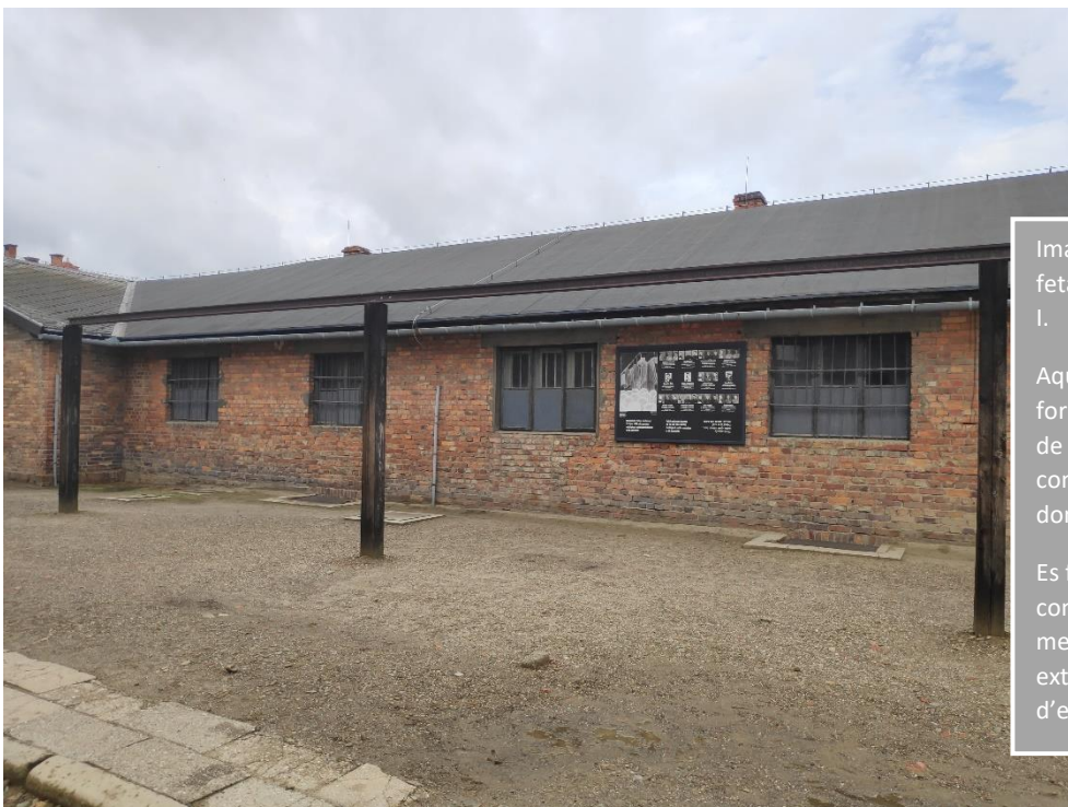
Imatge 19. Fotografia feta al pati d'Auschwitz I.

En cada llit (de cada llitera) hi havia unes 6 dones. Les dones més sanes eren les de la part superior. A la part inferior hi havia les de pitjors condicions. Els excrements, per exemple, podien caure d'un pis a l'altre de la llitera.