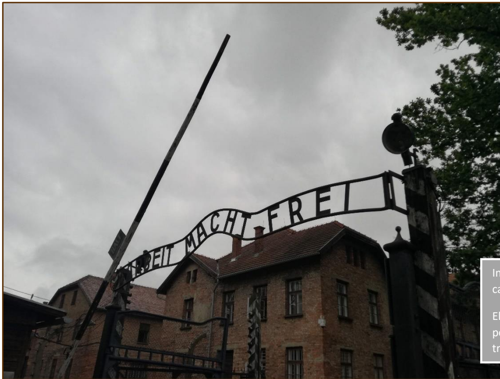
Imatge 12. Entrada al camp d'Auschwitz I.

Els alemanys hi van posar la inscripció: "El treball fa la llibertat"