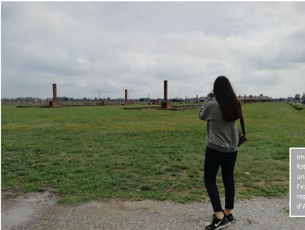
Imatge 17. En aquesta fotografia es pot veure una petita part de l'extensió del que va representar el camp d'Auschwitz II

Es troba a la plataforma de descàrrega a l'entrada a Auschwitz II Birkenau, i situat al punt on els nazis feien la primera selecció humana, triant qui viuria i qui moriria directament a les cambres de gas, situades al final del camp.