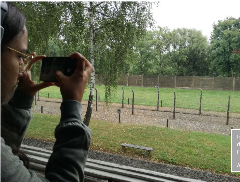
Imatge 13. Fotografia des de la finestra de l'interior d'un barracó.

Els alemanys hi van posar la inscripció: "El treball fa la llibertat"