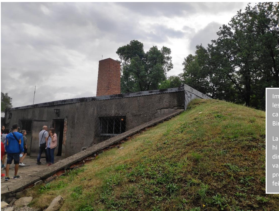
Imatge 21. Entrada a les cambres de gas del camp Auschwitz II Birkenau.

Tot i que quasi mai funcionaven i en moltes ocasions no hi havia aigua.