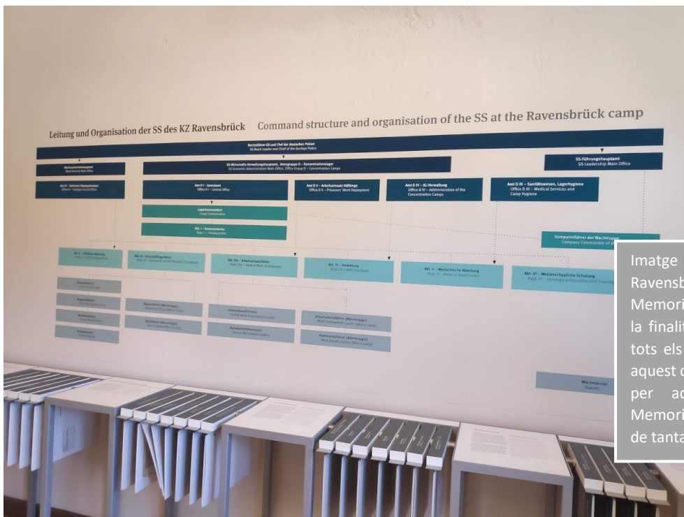
Imatge 4. El camp de Ravensbrück ha esdevingut Memorial de Ravensbrück amb la finalitat de donar a conèixer tots els fets que van passar en aquest camp de concentració. És per aquest motiu que el Memorial ens permet disposar de tanta informació.