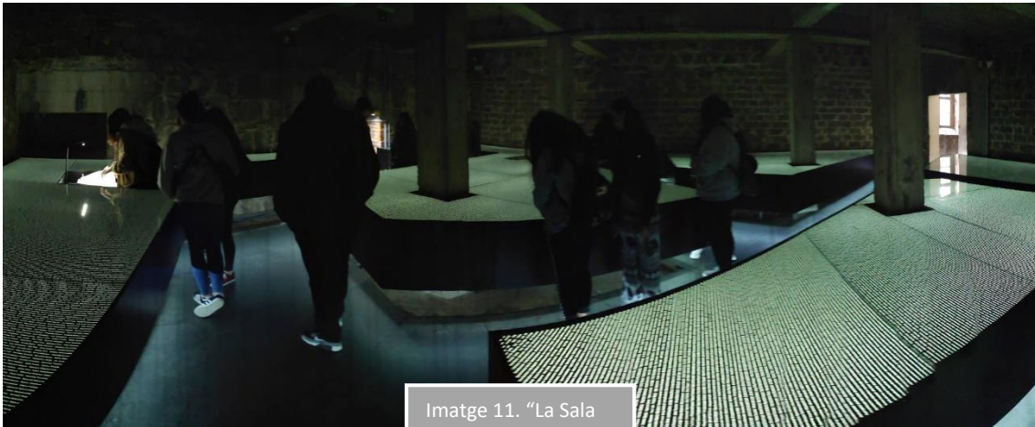
Imatge 11. "La Sala dels noms".

Correspon a tots els deportats que van passar per Mauthausen