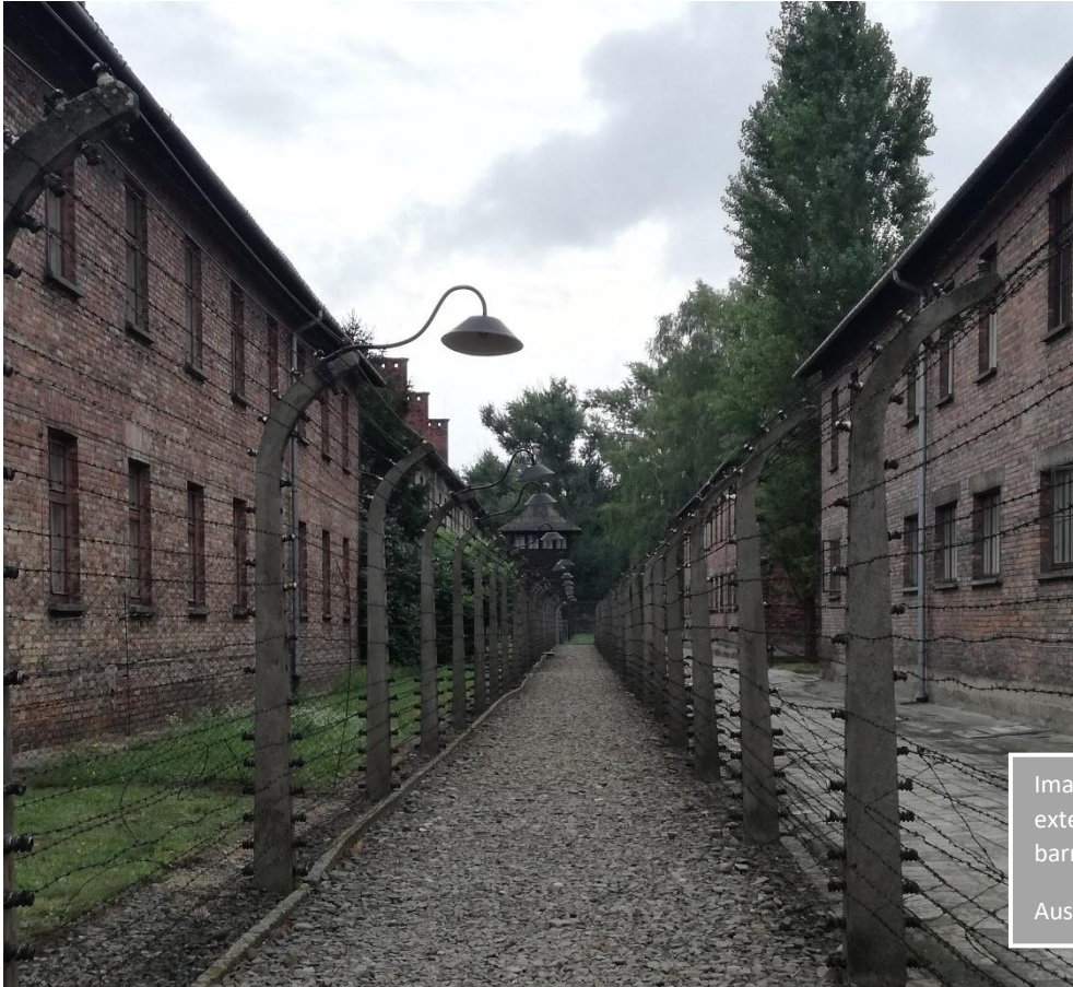
Imatge 14. Passadís exterior entre barracons.