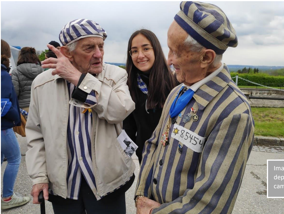
Imatge 5. Dos deportats jueus al camp de Mauthausen.