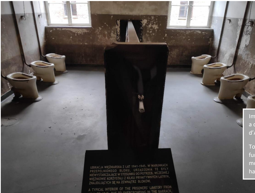
Imatge 20. Serveis per a dones del camp d'Auschwitz I.

Tot i que quasi mai funcionaven i en moltes ocasions no hi havia aigua.