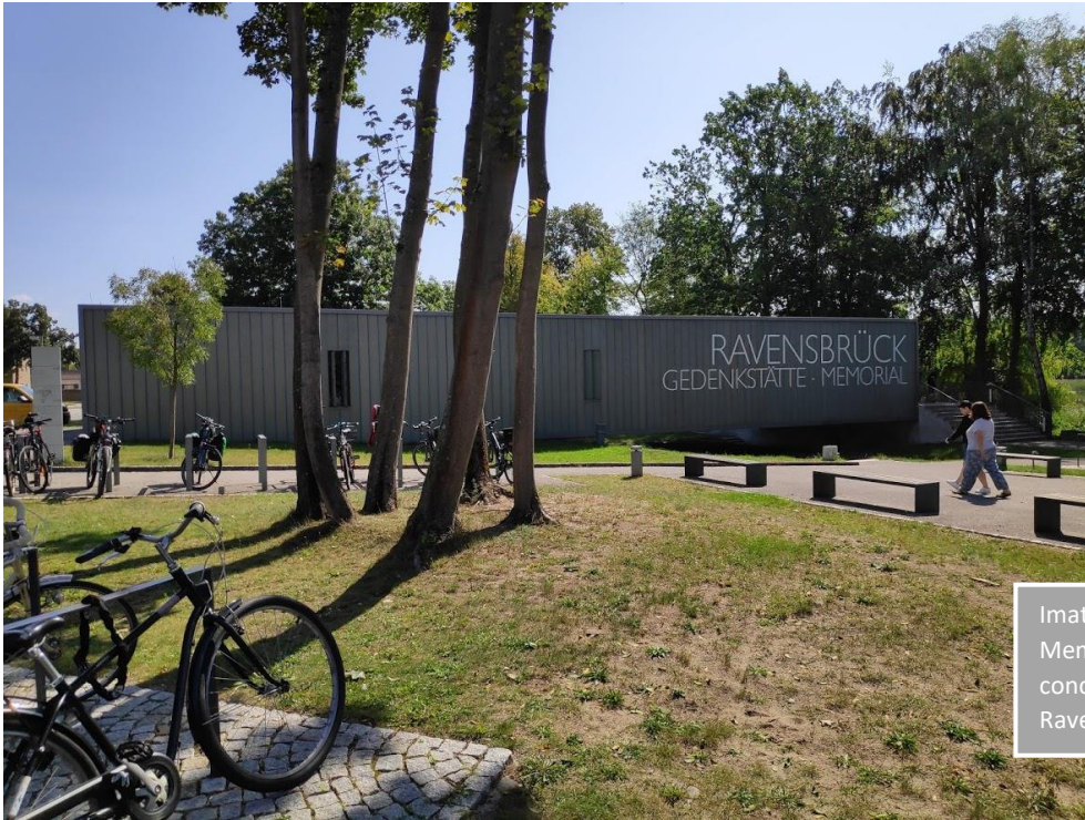
Imatge 1. Entrada al Memorial del camp de concentració de Ravensbrück.