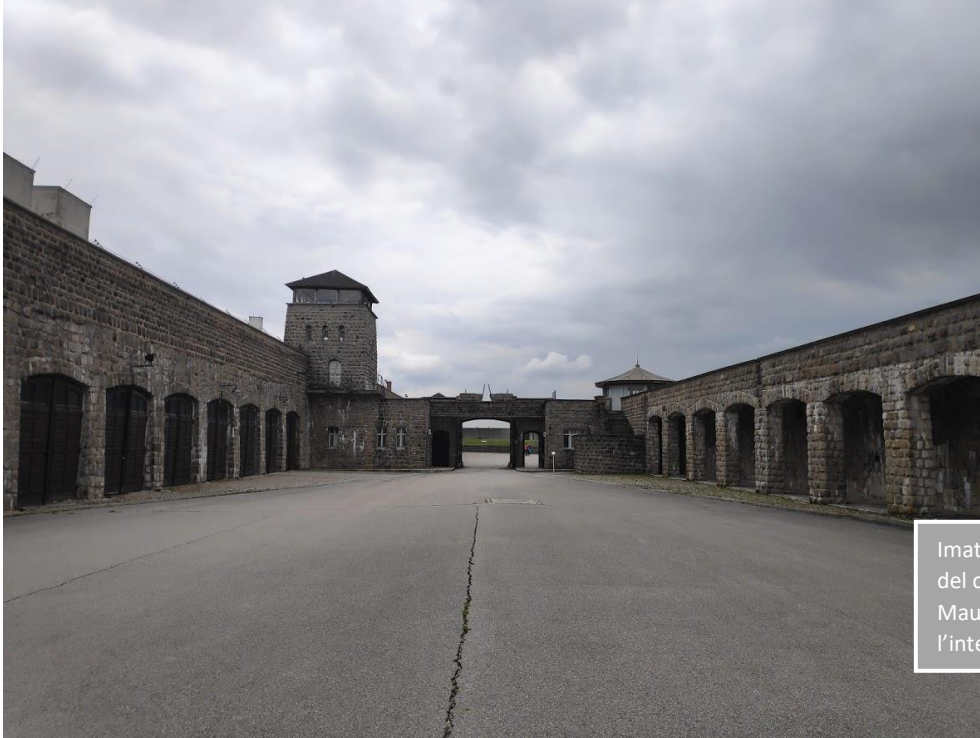
Imatge 7. Entrada del camp de Mauthausen des de l'interior.