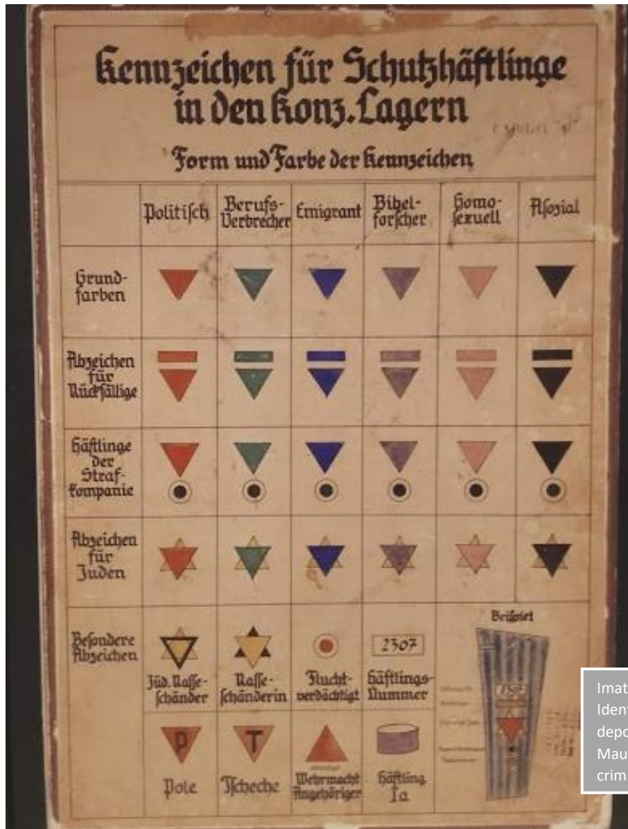
Imatge 9. Identificació dels deportats de Mauthausen pel seu crim.