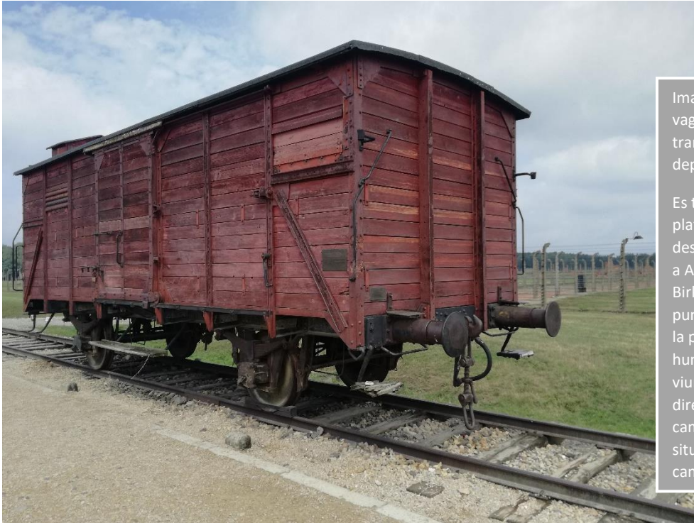
Imatge 16. Model de vagó com el que es transportaven els deportats/es al camp.

Es troba a la plataforma de descàrrega a l'entrada a Auschwitz II Birkenau, i situat al punt on els nazis feien la primera selecció humana, triant qui viuria i qui moriria directament a les cambres de gas, situades al final del camp.