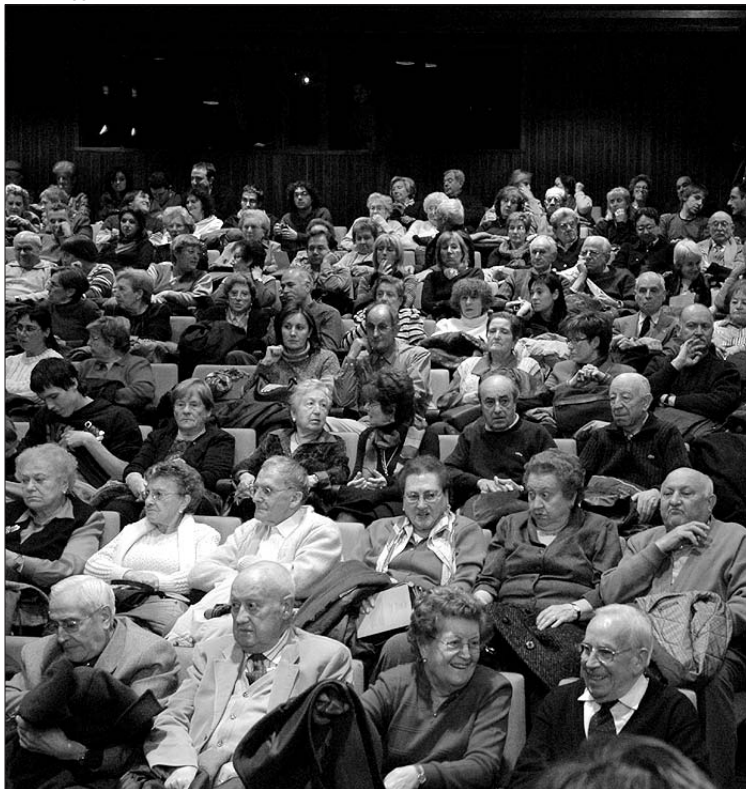
Aspecte del públic, que omplia de gom a gom la sala