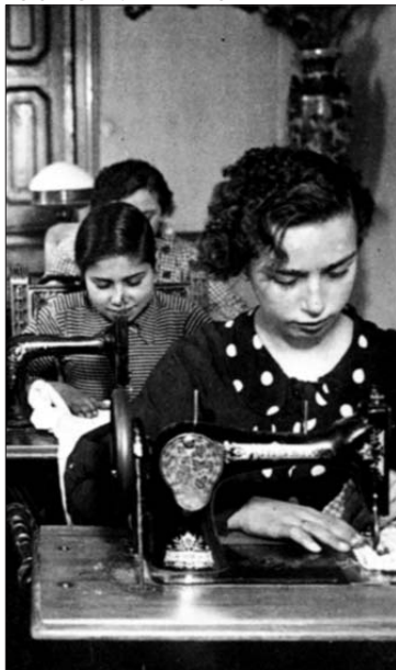
Cosidor a la Noguera