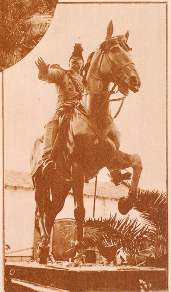
El gest solemne del que un dia fou dictador de la República de Santo Domingo i que avui presideix el tràngol quotidià dels Docks de Barcelona