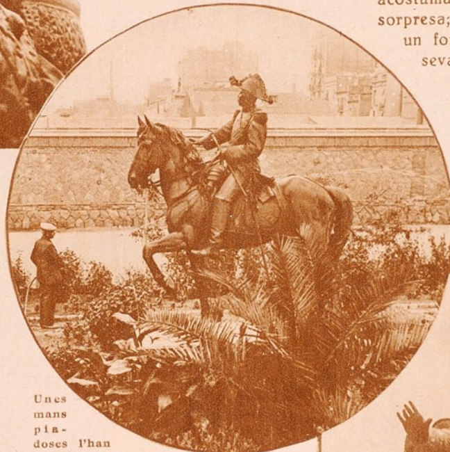
Unes mans piadoses l'han voltat de flors i d'una palmera, per tal que no s'enyori tant...

L'any 1897, a la República de Santo Domingo. El general negre Ulises Heureaux, com tots els generals d'aquelles latituds que saben l'ofici, creu arribat el torn de fer, ell també, la seva revolució. El pronunciamiento li surt bé, i ja el tenim convertit en dictador de Santo Domingo. Què farem ara? El general Ulises no dubta gens: És qüestió de fer-se aixecar una estàtua. Però... qui la farà? En tot el país