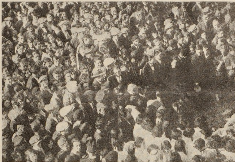
Auditori a l'aire lliure

—Mes ai! On són aquells navilis de l'en-